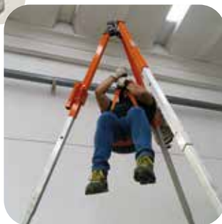
Illustrazione delle varie tipologie di cordini, dispositivi di collegamento e sistemi di ancoraggio

Prova di sospensione con imbracatura anticaduta